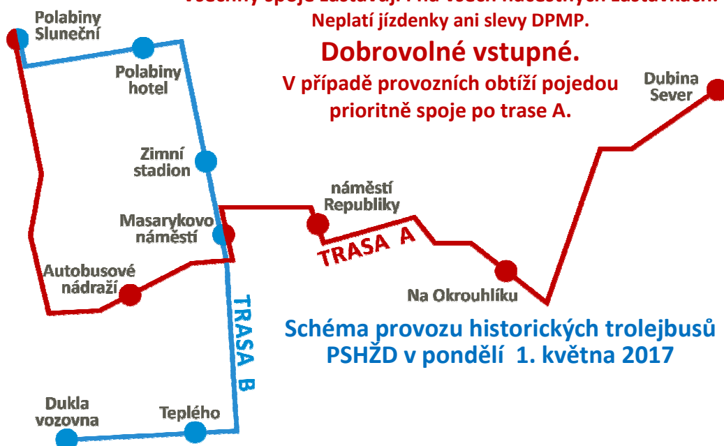
Schéma provozu historických trolejbusů PSHŽD v pondělí 1. května 2017

BONUSOVÁ AKCE pro skalní fanoušky MHD NOČNÍ FOTOJÍZDA TROLEJBUSU 353 30. dubna 2017 (noc ze soboty na neděli)